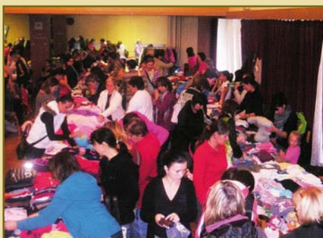
22. září - Burza dětských věcí. Bazárek se velmi vydařil - byla velká účast, jak prodávajících, tak nakupujících.