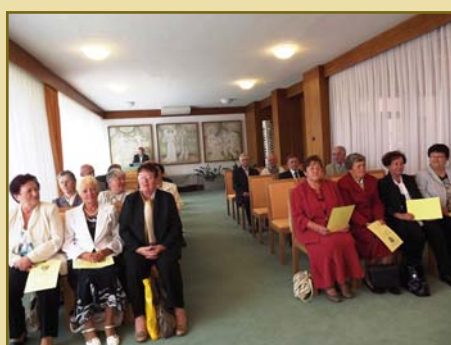
29. září - Setkání ročníku 1942