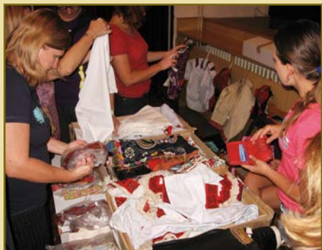
25. srpen – Burza krojů, kterou pořádala BAŇA