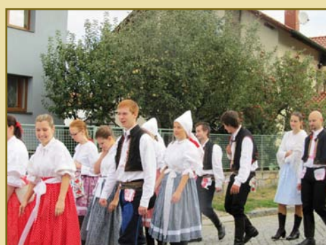
8. září - Slavnosti vína v Uherském Hradišti