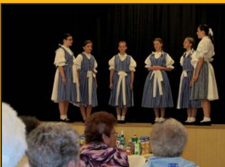
15. červen 2011 - Beseda s důchodci