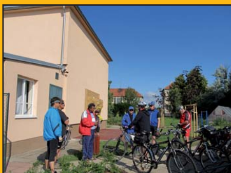
25. červen 2011 - Cyklovýlet