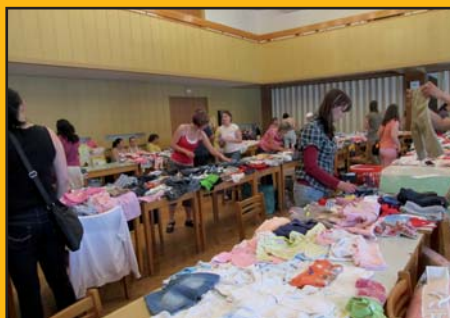
20. květen 2011 – Dětský bazárek