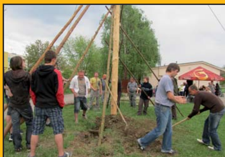
30. duben 2011 - Stavění máje - pořádali sportovci a hasiči u hřiště