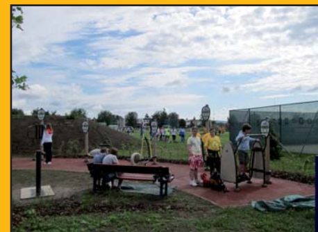
24. červen 2011 – Slavnostní ote- vření sportovního areálu pro děti