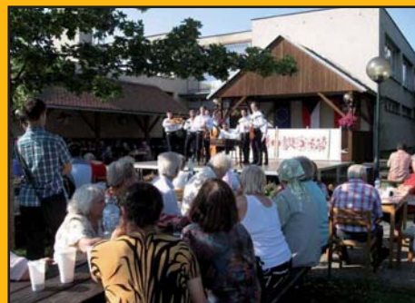
11. červen 2011 – „Výlety v zahradách“