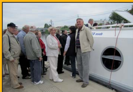
14. květen 2011 - Výlet lodí po Baťově kanále a posezení u cimbá- lu s CM Velehrad