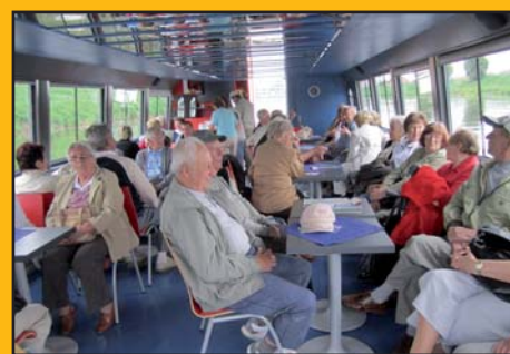
14. květen 2011 - Výlet lodí po Baťově kanále a posezení u cimbálu s CM Velehrad