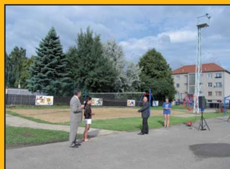
24. červen 2011 – Slavnostní ote- vření sportovního areálu pro děti