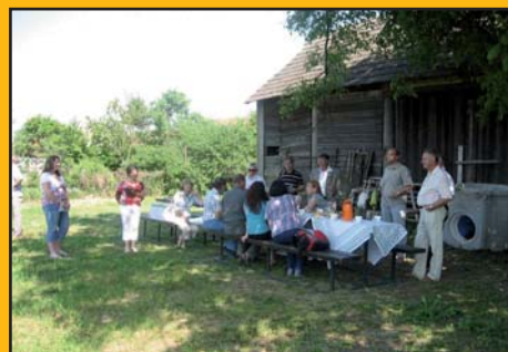
23. květen 2011 – Návštěva hodnotící komise soutěže Vesnice roku 2011 za Zlínský kraj