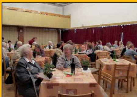
8. květen 2011 – Den matek - představení Podfuk divadla Tyjátr při Otrokovické besedě.