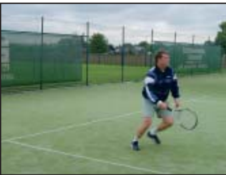
3. 6. 2006 tenisový turnaj mužů