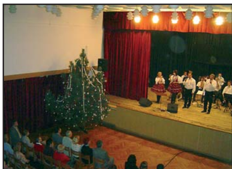
1.12. Vánoční koncert Stříbrňanky