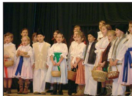
16.12. Vánoční koledování KALINKY