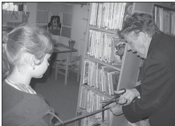
Otevření dětského koutku Sluníčko