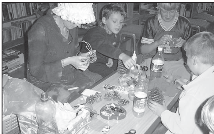
Zdobení pohádkových stromů