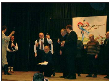
4.11. Křest CD CM St. Gabriela a knihy Písňe malované Slovákem na Derflanském poli.