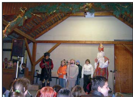
1.12. Mikulášská nadílka