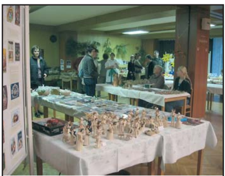
16.12. Vánoční jarmark

V pátek 17. listopadu odpoledne a v sobotu 18. listopadu dopoledne se v přísálí KD v Babicích konal BAZÁREK dětského zboží. A co se dalo všechno prodat nebo koupit? Dětské oblečení, boty, hračky, kočárky, postýlka, tříkolka i koberec. Někteří prodali, druzí zase koupili. Akce byla úspěšná, proto se můžete na bazárek těšit opět na jaře.