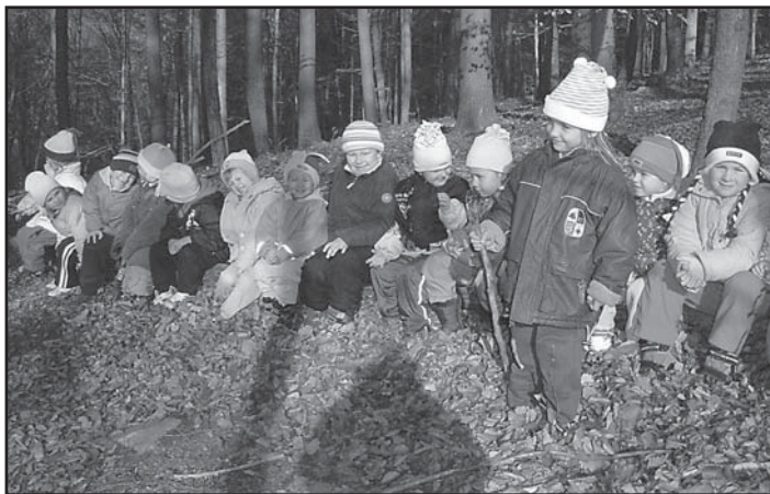
MŠ - Podzimní vycházka v Chříbech