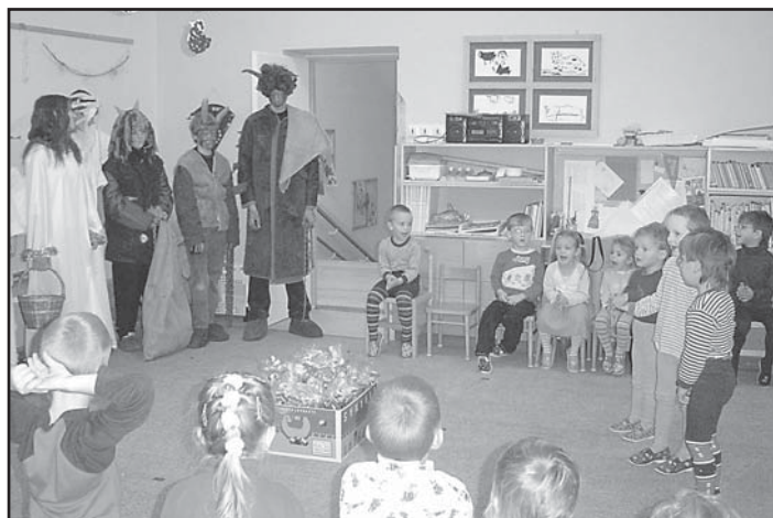
MŠ - Vánoční besídka