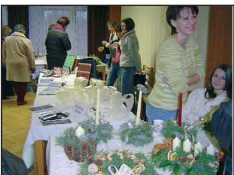
1.12. Vánoční jarmark