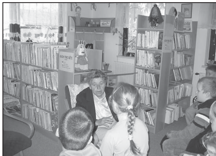
Dětský koutek Sluníčko