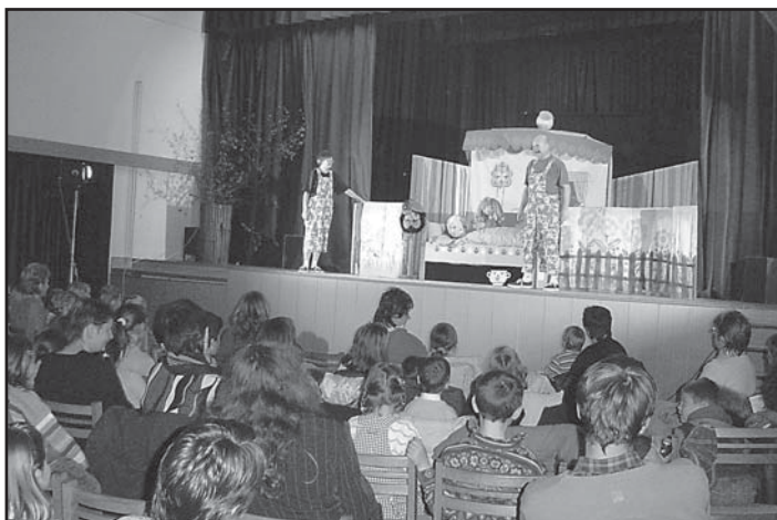
MŠ - Představení divadla Říše loutek z Kroměříže