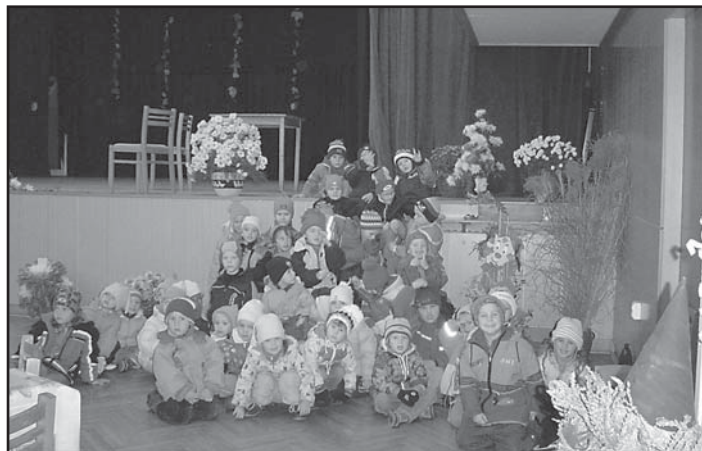
MŠ - návštěva podzimní výstavky