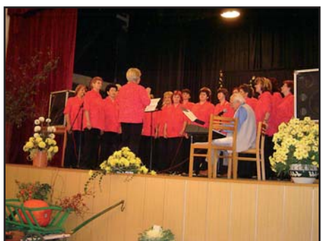
12.11. Koncert ženského sboru z Otrokovic