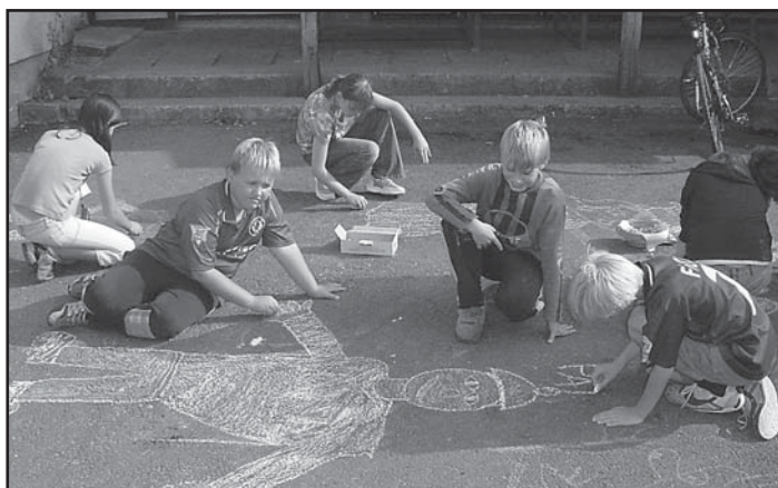
Kreslení před knihovnou