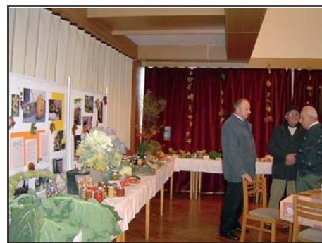
12.11. Podzimní výstava