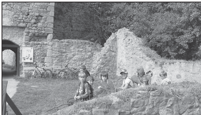
Výlet na Lukov