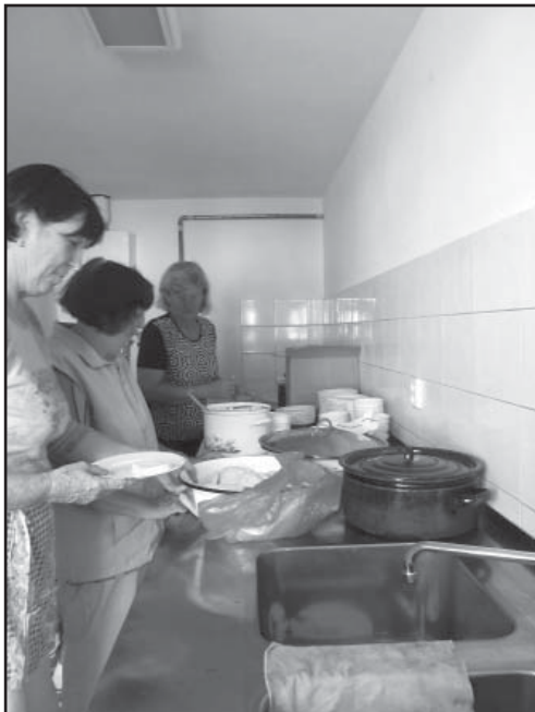
Ze života našich stříčků 18. 6.

O dalším programu Klubu důchodců se včas dozvíte z vývěsních skříněk v obci nebo z hlášení místního rozhlasu. Klub je otevřený všem zájemcům, stačí přijít.