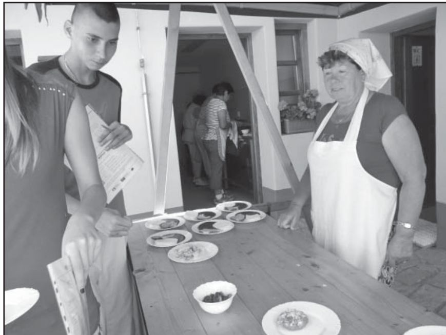
Ze života našich stříčků 18. 6. 2014