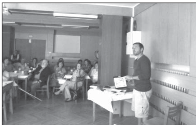
Klub důchodců 4. 9. 2014

Jinak prázdninové měsíce červenec a srpen znamenají „volno“ i v činnosti Klubu